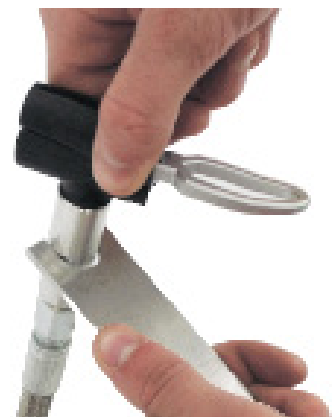
Byte av munstycke